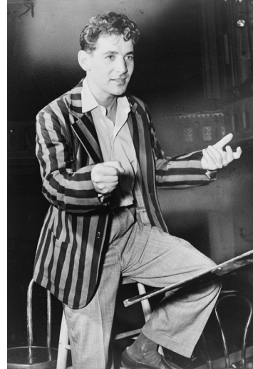
Леонард Бернстайн (1918-1990 рр.)