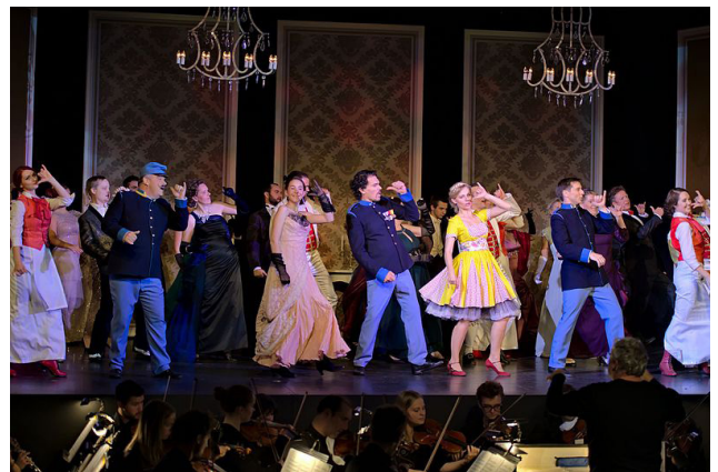
Сцена з оперети (фестиваль оперети «Осінні дні у Блінденмаркті», Австрія)