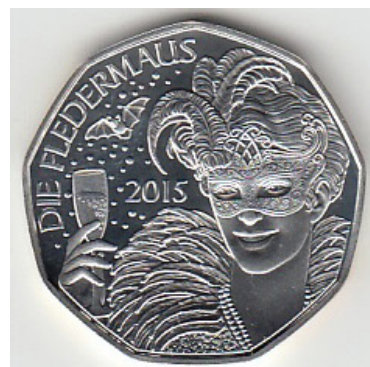
Австрійська срібна колекційна монета номіналом у 5 євро із зображенням головної героїні оперети Й. Штрауса (сина) «Летюча миша» у маскарадному костюмі