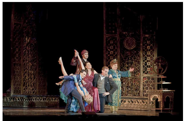
Артисти Будапештського театру оперети (Угорщина)