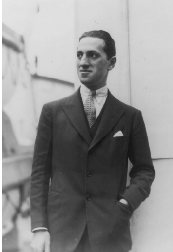
Джордж Гершвін (1898-1937 рр.)