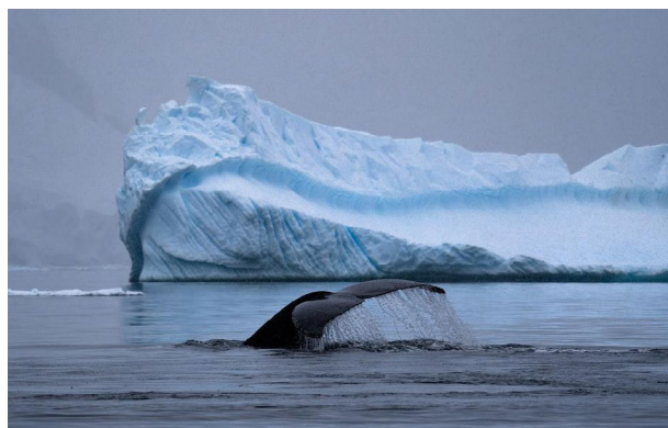
Хвіст кита і айсберг

Органічний світ бідний, життя в Антарктиді існує переважно на окраїнах материка. Символом Антарктиди є пінгвіни. Крім них у прибережних водах живуть морські леопарди, кити, кашалоти, косатки. Пташиний світ представлений буревісни-