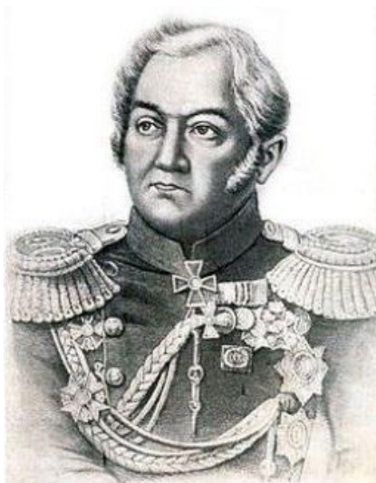
Михайло Лазарєв (1788-1851)