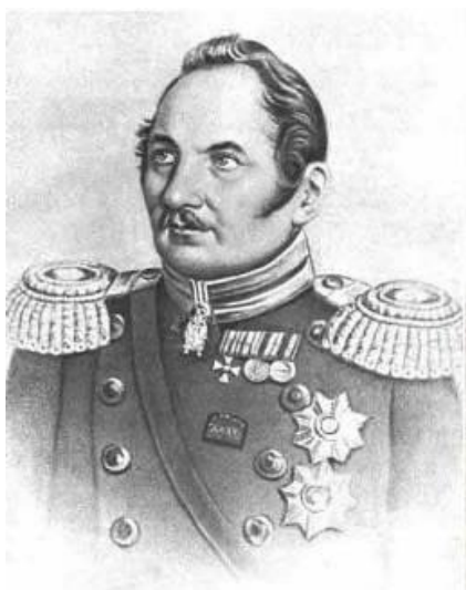
Фадей Беллінсгаузен (1778-1852)

Дослідження, які проводять в Антарктиді, надзвичайно важливі, адже цей материк впливає на всю природу Землі. Тут заборонені будь-які військові випробування, і жодна з країн не може претендувати на ці території. Юридично це закріплено міжнародною угодою, підписаною 1 грудня 1959 року.