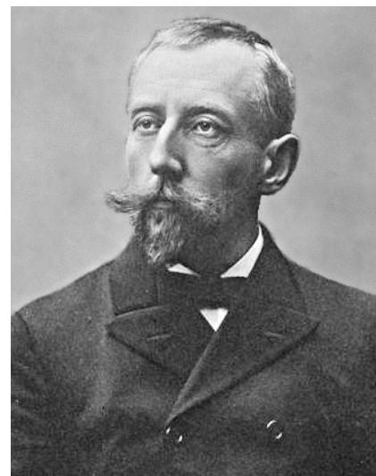
Руаль Амундсен (1882-1928)