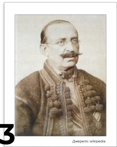
3 Юрій Федькович (1834–1888)

1. Галицький політик, лідер народовців. Член-засновник і голова «Просвіти» (1896–1906). Ініціатор і видавець першої газети для селян «Батьківщина» (1879–1896).