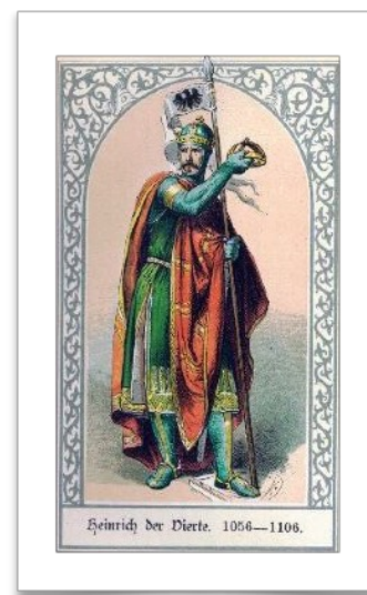
Імператор Священної Римської імперії Генріх IV