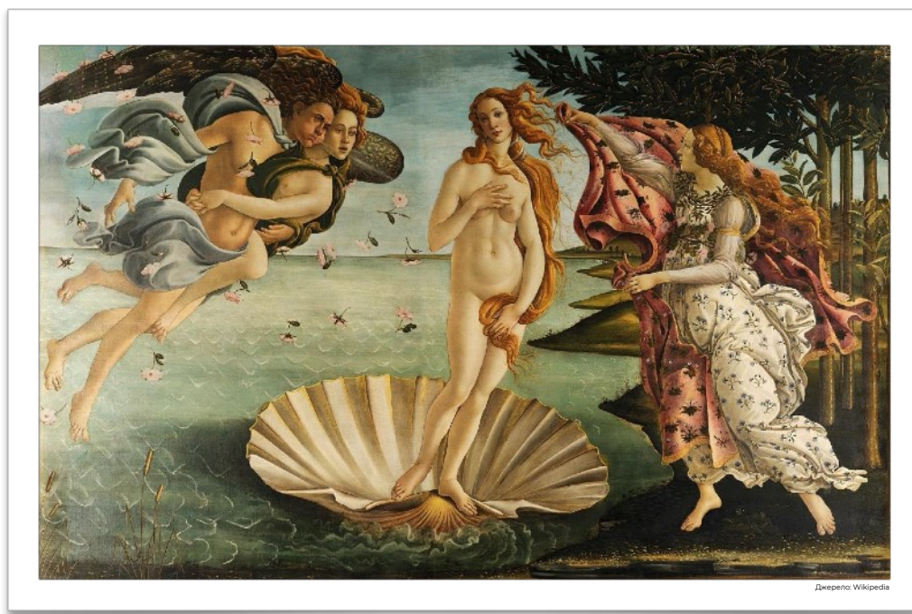
Картина «Народження Венери», Боттічеллі, 1485 р

У XV ст. творив свої шедеври флорентієць Сандро Боттічеллі . Одна з його найвідоміших робіт базується на античній міфології. Це зображення давньогрецької богині Венери. Зверніть увагу, персонажі картини зображені красивими, сповненими життя, з яскраво вираженими індивідуалізованими рисами обличчя. Кого б він не малював — християнських святих чи богів Античності, вони незмінно наділені людськими почуттями, рисами, характерами.