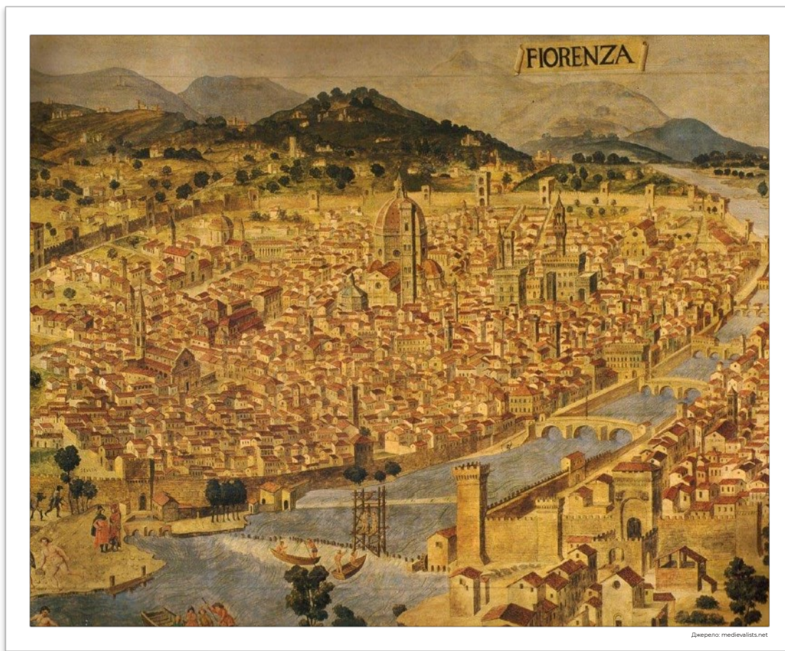
Флоренція в добу Раннього Відродження

Коли вплив католицизму дещо зменшився, митці починають зображати не лише велич Бога та гріховність людини, а ще й почуття й людську сутність. Взірцем для них буде саме антична культура, тобто почнеться її відродження, або італійською «ренесанс». Раннє Відродження тривало із середини XIII до кінця XV ст.