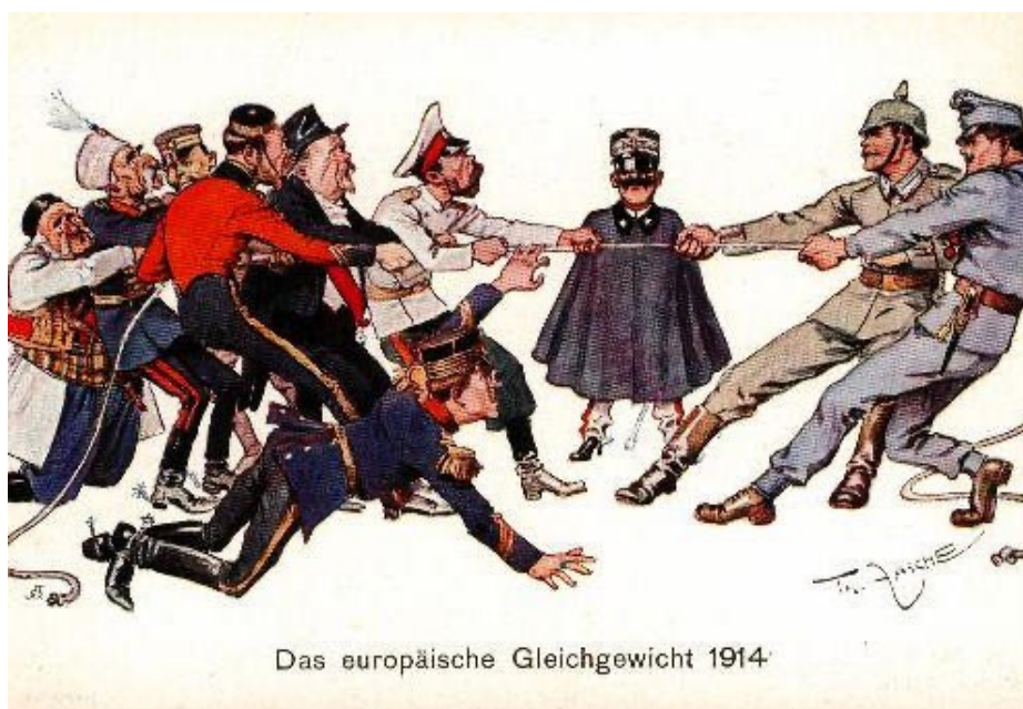
«Європейський баланс», німецька карикатура 1914 р.

Унаслідок загострення протиріч між провідними європейськими державами утворилися два військово-політичні об'єднання: Троїстий союз (Німеччина, Австро-Угорщина й Італія) у 1882 р. та Антанта (Велика Британія, Франція, Росія) у 1904–1907 рр.