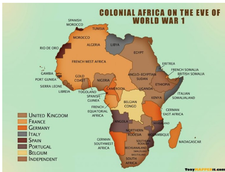
Колоніальна Африка напередодні Першої світової війни

Чи не найбільше відзначилась у локальних конфліктах в Африці Велика Британія, яка під час англо-бурських війн масово задіяла кулемет «Максим» та камуфляж, запровадила практику концентраційних таборів та розпочала застосування снайперського озброєння.