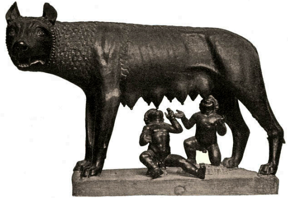
2. Скульптуру на честь вовчиці