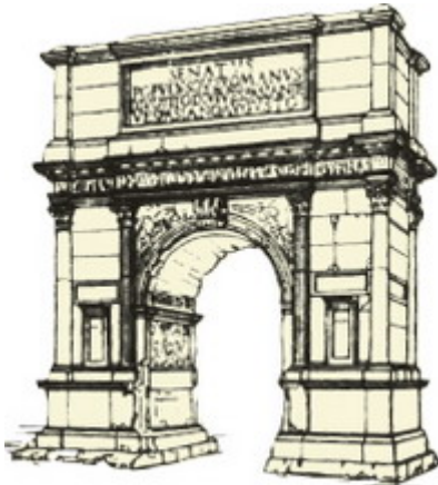
3. Триумфальну арку