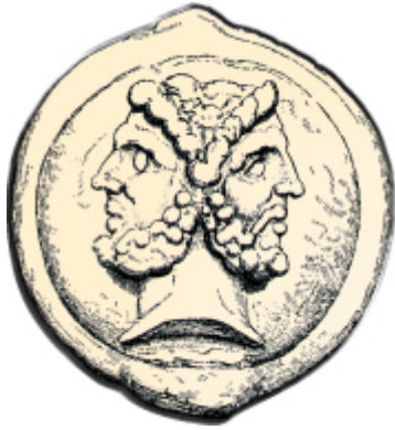
1. Мурал на честь ромула і Рема

пагорбі де їх вигодувала вовчиця. Але під час сварки за землю, Ромул убив Рема, а в 753 р. до н.е. заснував місто, яке назвав на власну честь - Римом. Екскурсовод запитує, як ви думаєте, який символ створили римляни на честь цієї легенди? Якщо Ви правильно відповісте, то отримаєте пропуск до Колізею.